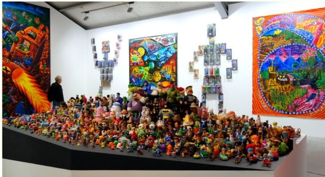
Exposition "Hervé Di Rosa et les Arts Modestes" La Maison Rouge, Paris 2017

Il s'agit pour l'art modeste de mettre en valeur les choses les plus banales , les plus quotidiennes, en portant sur elles un regard qui n'est plus utilitaire, mais chargé d'affection , grâce à des assemblages, des mises en scène, à la création d'environnements qui vont leur donner une âme .